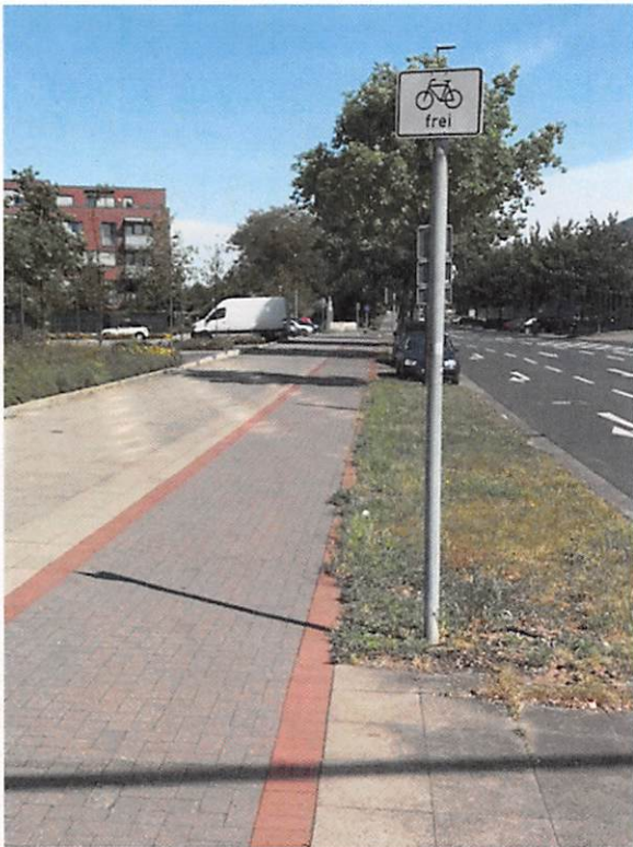
Radweg Eulenkamp Einmündung Edgar-Scheibe-Str. Richtung Norden: