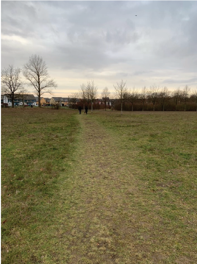
Personen auf dem Graspfad