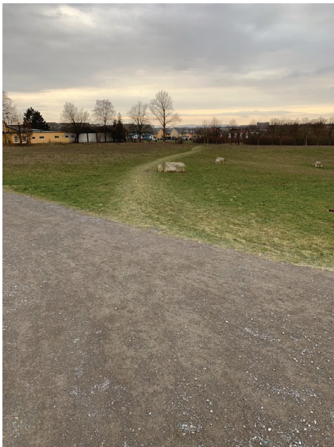
Gesamtansicht des Graspfades