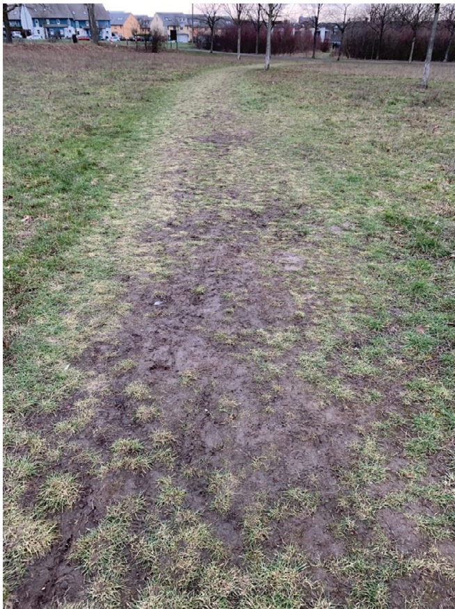
Zustand des Graspfades