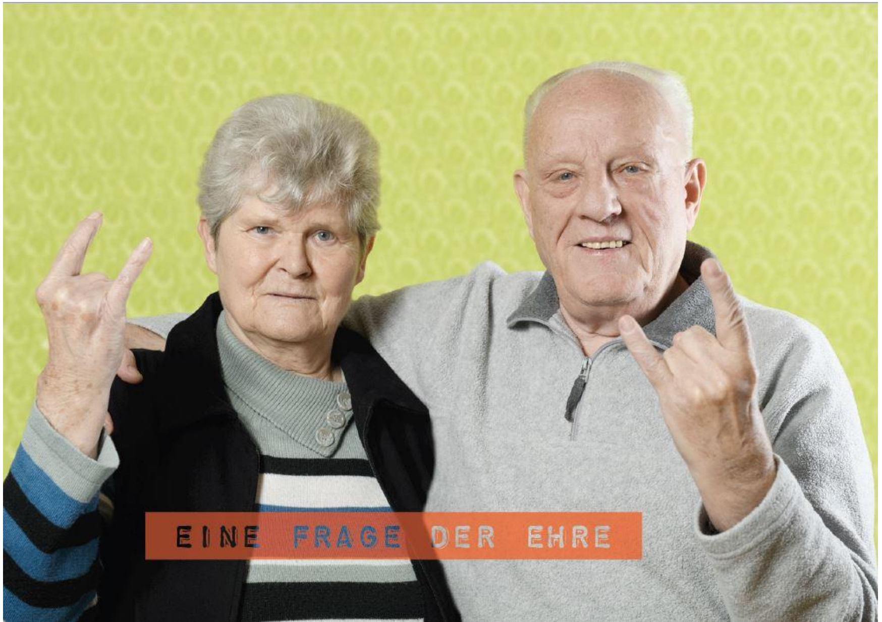
Postkartenaktion „Eine Frage der Ehre“ unter Einbindung eines ehrenamtlich aktiven Ehepaars aus Hainholz