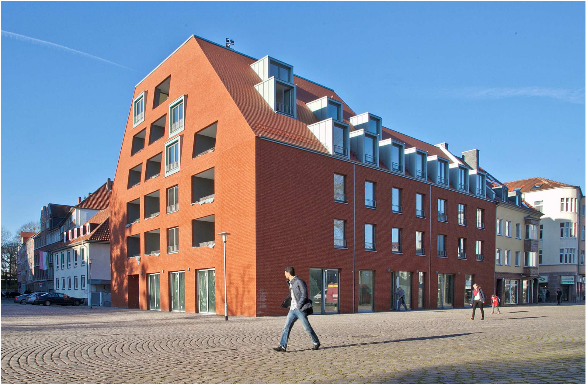
An der Christuskirche