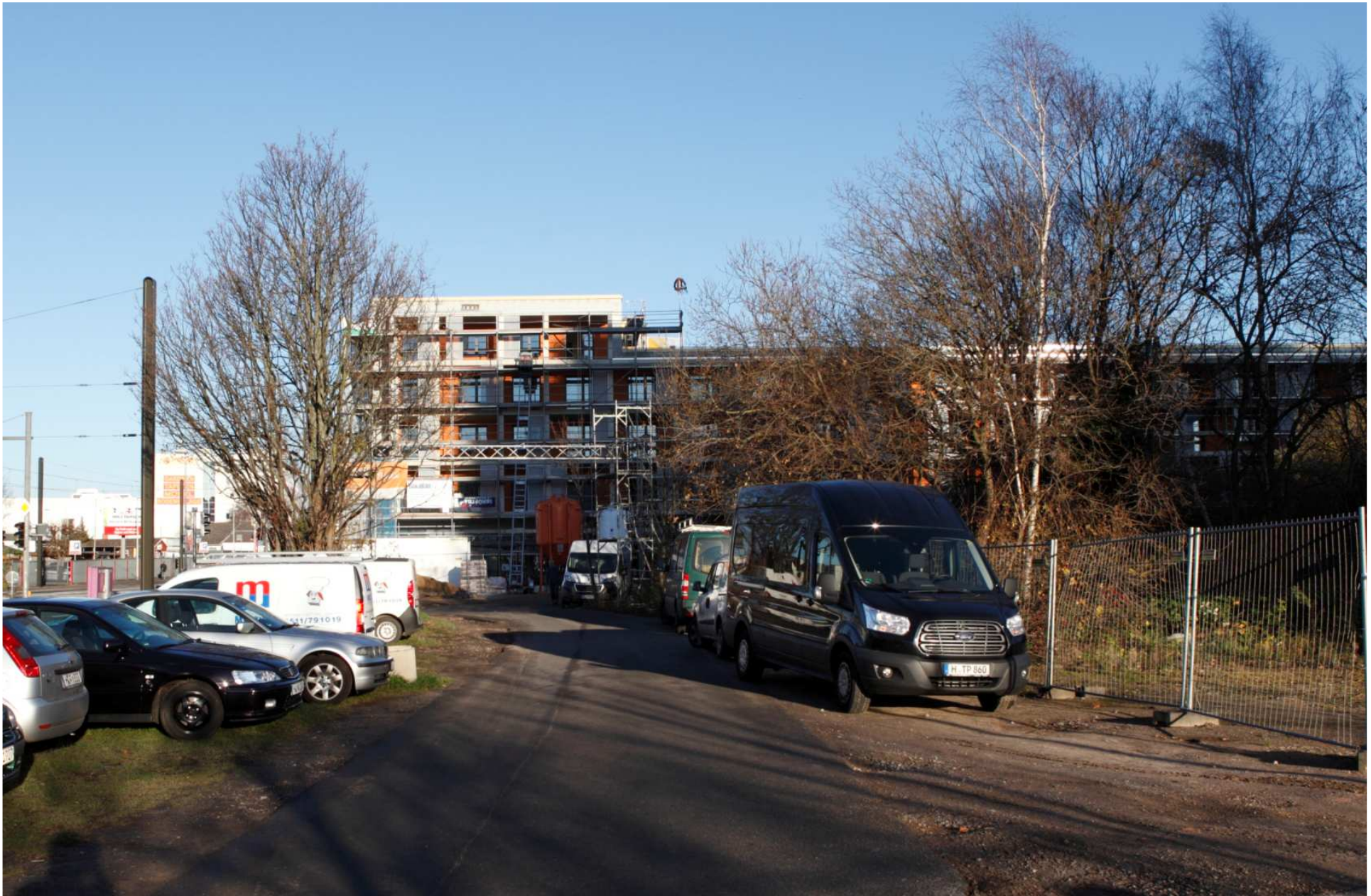
Hainhölzer Markt Nord