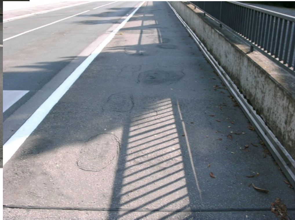
Blasenbildung im Belag Geh- und Radweg