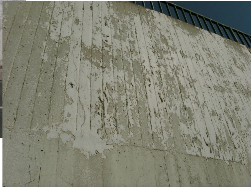
abblatternde Wandbeschichtung, Detail