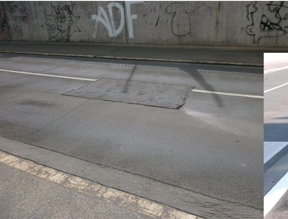
Schaden in der Fahrbahnflache