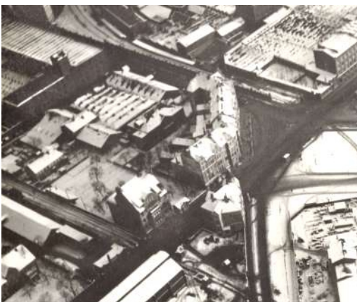
Bebautes Eckgrundstück Limmerstraße/ Spinnereistraße/Elisenstraße 1912