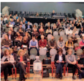
Interner Dialog der Stadtverwaltung; Plenum 29. Januar 2015

(Beitrag einer Dialogveranstaltung der Stadtverwaltung)