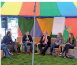
Gesprächsrunde mit dem Oberbürgermeister; Stadtjugendtag, 26. September 2015

Bitte kein Kopfsteinpflaster. (Rollstuhlfahrerin, Dialogveranstaltung in Kooperation mit der Lebenshilfe Hannover)