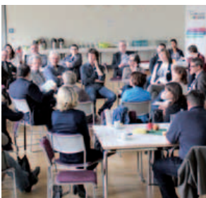
MitarbeiterInnen diskutieren die Zukunft der Stadtverwaltung; 23. Januar 2015

(Beitrag einer Dialogveranstaltung der Stadtverwaltung)