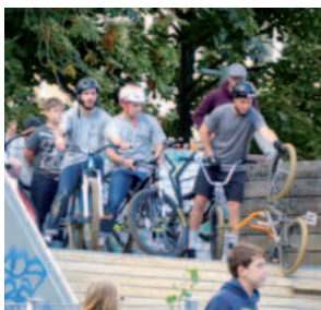
BMX-Szene in Aktion; Stadtjugendtag, 26. September 2015

Jugend braucht neben den Herausforderungen in Schule, Ausbildung und Beruf einen Freiraum, eine Ressource aus Raum und Zeit. Er muss Möglichkeiten zur persönlichen Weiterentwicklung bieten, zum Ausprobieren und Grenzen überschreiten. Eine jugendgerechte Kommune muss Räume überlassen [auch öffentliche] und Prozesse zulassen können, damit sich Jugendkultur in der Stadt entwickeln kann.