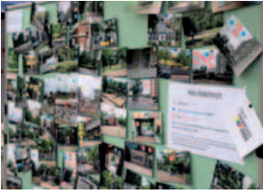
Bilder eines Stadtteils; „Open-Air-Dialog“ Roder- bruchmarkt, 30. Mai 2015

Die Nachbarschaft muss ge- stärkt werden, da Quartiere oft schon zu groß sind. Anlässe für das gemeinsame Kennen- lernen und Treffen müssen gegeben werden. (Teilnehmerin einer Dialog- veranstaltung)