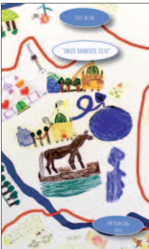
Plan der Stadt 2030 aus Kindersicht, Workshop 5. Mai 2015

Das Freiraumentwicklungskonzept ist ein mittel- bis langfristiges Planungsinstrument zur Sicherung und zukunftsfähigen Gestaltung des Grünflächensystems. Dazu gilt es, zukünftige Anforderungen zu definieren, wie zum Beispiel gute Erreichbarkeit, klimagerechte Gestaltung oder inklusive Nutzbarkeit, und Strategien für die Freiräume Hannovers zu entwickeln. Das Ziel- und Maßnahmenkonzept, das am Ende des verwaltungsinternen Abstimmungsprozesses steht, soll mit Berufsverbänden, der Öffentlichkeit und der Politik diskutiert und anschließend sukzessive umgesetzt werden.