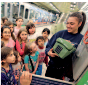
Sicher mit Bus und Bahn; Mädchen-Mobilitätstag, 24. April 2015

Die Landeshauptstadt Hannover hat sich erfolgreich beim Bundesprojekt „Jugendgerechte Kommune“ beworben und ist als Referenz-Kommune ausgewählt worden. Die Ziele des Bundesprojektes und die oben formulierten Grundsatzziele einer jugendgerechten Stadtentwicklung sind nahezu deckungsgleich. Ziel der jugendgerechten Stadtentwicklung ist eine qualitative Fortentwicklung der örtlichen Beteiligungsstrukturen. Die Stadt Hannover orientiert sich dabei an den Leitsätzen der eigenständigen Jugendpolitik und vertritt ihre Grundsätze.