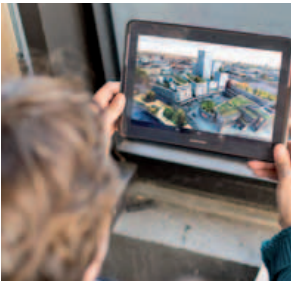
Jugend erforscht Stadt; Familiensonntag, 19. Oktober 2014

Mit Blick auf die öffentlichen Räume sollen auch hier Möglichkeiten gesichert und geschaffen werden, die eine vielfältige soziale Platzaneignung und damit gleichermaßen Teilhabemöglichkeiten an außerschulischen Bildungsangeboten von Mädchen ermöglichen. Die geschlechterbezogenen Angebote im Kultur-, Bildungs-, Freizeitbereich werden ausgebaut. [Mehr] Zukunftstage, Praxis- und Berufsparcours [in der Verwaltung, in Einrichtungen und Unternehmen] unter Beteiligung von Mädchen werden initiiert und organisiert.