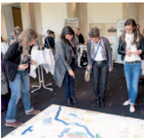
BesucherInnen entdecken den Stadtplan von morgen, 24. Juni 2015

Hannovers Grünstruktur garantiert die hohe Lebensqualität in der Stadt. Deshalb hat der Erhalt von unbebauten Freiflächen auch zukünftig hohe Priorität. (Ergebnis der Arbeitsgruppe „Grüner Kreis“, 18. März 2015)