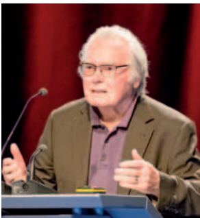
Die Kultur der Städte ist einer der wichtigsten Faktoren für ein Gelingen Europas als einem Europa der Regionen. (Prof. Dr. Oskar Negt, Soziologe und Philosoph)

Kultur und Bildung sowie die zugehörigen Infrastrukturen sind wesentliche Standortfaktoren Hannovers. Hier kann Hannover punkten, da von der Bildung und Betreuung von Kindern in Krippen, Kindertagesstätten und Schulen bis zur Ausbildung an Universität oder im Betrieb, von der berufsbegleitenden Ausbildung bis zur Erwachsenenbildung ein vielfältiges Angebot bereit steht. Das gilt auch im Kulturbereich der Landeshauptstadt von der Stadtteilkultur, vielen kulturellen Kleinoden bis hin zu den großen Museen und Bühnen. Bildung und Kultur sind der Stadt wichtig, da beide prägend für die Kreativitäts- und Persönlichkeitsbildung des Menschen sind.