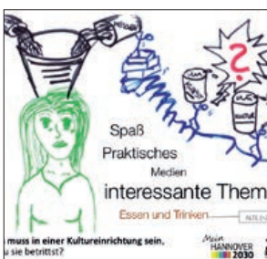
Ergebnisseite des Jugendpanels zu Bildung und Kultur

Mein Hannover 2030 ist bunt und lebendig. Und hat noch ein paar Geheimnisse. (mündlicher Beitrag einer Dialogveranstaltung)