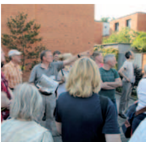
„Städtebau im Dialog“ – per Bus die Stadt erfahren, 16. Juli 2015

Hannover wird weiter an der Qualifizierung der öffentlichen Räume, der stadtbildprägenden Gebäude und Objekte arbeiten. Durch die Tradition als Residenzstadt und den Wiederaufbau nach dem Krieg geprägt will die Stadt stärker an ihrer Gestalt , ihrer Identität arbeiten. Hierzu werden Nutzungs- und Gestaltungskonzepte erarbeitet [zum Beispiel City-Ring, Innenstadt, Stadteingangsstraßen, Stadtteile]. Für stadtbildprägende Räume oder Gebäude werden Wettbewerbsverfahren oder konkurrierende Verfahren initiiert, um eine möglichst große Bandbreite an Gestaltungsmöglichkeiten zu beleuchten. In diese werden die Anforderungen von Nachhaltigkeit und Klimaschutz und Klimaanpassung einbezogen. Das Stadtplatzprogramm wird fortgeführt. Das Innenstadtkonzept Hannover City 2020+ hat wichtige Impulse für die Entwicklung der Innenstadt gesetzt. Diese werden nun weiter in die Realität umgesetzt.