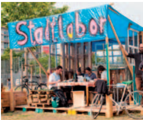
Palettenbühne im Möhringsberg Park, Juni 2015

Ich sehe schon, dass es viele in die Ballungszentren zieht und dort dann der Wohnraum knapp wird und die Mieten steigen. Das ist ein Problem. (mündlicher Beitrag einer Dialogveranstaltung)