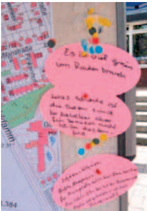
Anmerkungen zum Stadt- teil; „Open-Air-Dialog“ Roderbruchmarkt, 30. Mai 2015

Der Roderbruch ist manchmal wie ein kleines Dorf.