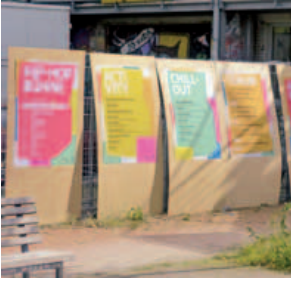
Program so bunt wie die Szene; Stadtjugendtag, 26. September 2015

familienpolitischen Handlungsfähigkeit finden sich im Programm „Weiterentwicklung der Familienpolitik 2015 – 2020“.