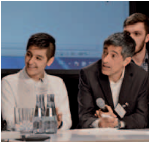
Ranga Yogeshwar, Journalist, (re) im Gespräch zum Thema „Wie schaffen wir gute Bildung?“, 16. März 2015

Eltern sollen besser auf die Schule vorbereitet werden (Elternteil bei Familienkonferenz)