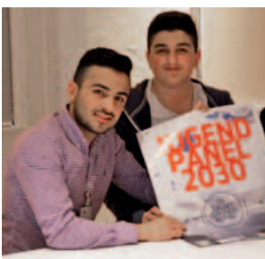
SchülerInnen präsentieren Ergebnisse des Jugendpanels; Veranstaltung zu Kultur- und Bildungsnetzwerken in Stadtteilen, 4. Mai 2015