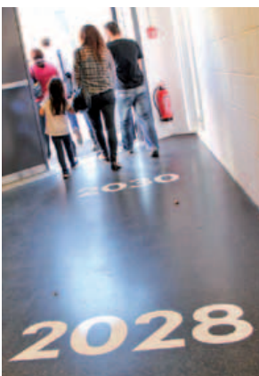
Die Zeitreise beginnt; Familiensonntag, 19. Oktober 2014

Geld alleine spielt keine große Rolle; Glück ist ebenso wichtig. (Teilnehmerin Stadtjugendtag)