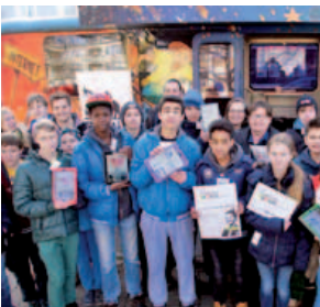
Die Befragung startet am Stöckener Markt: Jugendpanel zu Bildung und Kultur; 13. Februar 2015

Hannover verfügt über ein reiches, kulturelles Angebot. Überregional strahlende Kultureinrichtungen wie insbesondere Sprengel Museum, Herrenhäuser Gärten, KunstFestSpiele und Staatstheater in Kombination mit einer bunten, innovativen Off-Szene machen die Stadt zu einem spannenden, vielfältigen Ort, in dem Kultur mit allen gelebt wird. Mit seiner Vielfalt, seiner Geschichte sowie der optimalen Infrastruktur hat Hannover das Potenzial, sich zur Kulturhauptstadt 2025 zu bewerben.