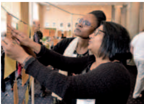
Teilnehmerinnen der Veranstaltung „Wie wollen wir wachsen“, 24. Juni 2015

Grundsätzlich gibt der Flächennutzungsplan Aufschluss über die künftige Flächenverteilung. Auf seiner Basis wird beurteilt, wie Flächen künftig angesichts der