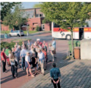
„Städtebau im Dialog“ – per Bus die Stadt erfahren, 16. Juli 2015

Zum Thema Mobilität wurde im Stadtdialog sehr breit gefächert diskutiert: EinzelhändlerInnen, UnternehmerInnen, ArbeitgeberInnen möchten eine perfekte Anbindung ihrer Standorte an die Verkehrsnetze. Anlieferung und Transport von Waren sollen reibungslos laufen. BewohnerInnen der Innenstadt wünschen sich ein Mehr an umweltfreundlichen, leisen und platzsparenden Mobilitätsformen . Menschen in den äußeren Stadtbezirken wollen schnelle, gute und durchgehende Verbindungen in die Stadt und das Umland. Auf den ersten Blick sind diese unterschiedlichen Anforderungen nicht miteinander vereinbar. Für die Zukunft sind die Menschen gefordert, stärker auf umweltfreundliche Mobilitätsformen zu setzen. Der individuelle motorisierte Verkehr ist großer Verursacher von Emissionen. Veränderungen sind erforderlich, um Beiträge zum Klimaschutz und zur Energiewende zu leisten. Hier ist Hannover auf einem guten Weg – aber noch nicht am Ziel. So muss unter anderem auch für den Wirtschaftsverkehr eine klimafreundliche Lösung gefunden werden.