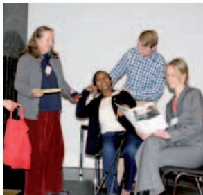
Rollenspiel; Veranstaltung „Alter(n)sgerechte Quartiersentwicklung“, 4./5. März 2015

Um sich wirklich heimisch zu fühlen, braucht man Zeit. (Christos Panzatis, Mitglied des Niedersächsischen Landtages)