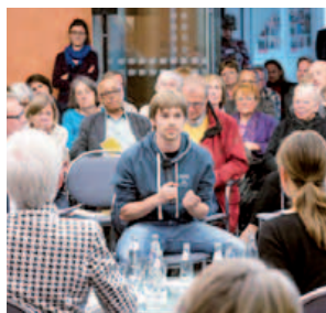
Engagierte Diskussion zur Frage „Wie wollen wir wachsen“, 24. Juni 2015

Der Masterplan 100 Prozent für den Klimaschutz entwickelt das Zukunftsbild einer klimaneutralen Stadt und Region Hannover im Jahr 2050 und wurde im Rahmen eines breiten Beteiligungsprozesses erarbeitet. Ziel ist es, bis zum Jahr 2050 die Treibhausgasemissionen gegenüber 1990 um 95 Prozent und den Energieverbrauch um 50 Prozent zu senken. Die gesamte Stadtgesellschaft und auch die Unternehmen in Hannover leisten ihre notwendigen Beiträge zur Energieeinsparung und nutzen verstärkt regenerative Energien. Diesen Masterplan konsequent umzusetzen und somit auch unseren Beitrag zur Energiewende zu leisten, ist Aufgabe der kommenden Jahre. Folgende Einzelbausteine werden realisiert: