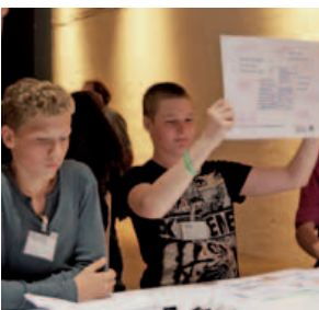
SchülerInnen präsentieren Ergebnisse des Jugendpanels; Veranstaltung zu Kultur- und Bildungsnetzwerken in Stadtteilen , 5. Mai 2015

Im Bereich der Erwachsenenbildung gilt einmal mehr, die Förderkulisse ziel- und zielgruppengerecht umzusteuern. Hier wird in einem Modellprojekt mit Stadt, Region, Land und Arbeitsagentur gezeigt, wie diese Umsteuerung der Ressourcen sinnvoll erfolgen kann. Eine Akademie für Erwachsene soll über das zentrale