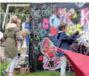
Graffiti legal; Stadtjugendtag, 26. September 2015

Mein Hannover 2030 ist meine grüne, kinder- und altersfreundliche Fahrradstadt. (Beitrag auf Zitat-Wand)