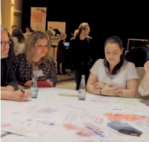
Arbeitsstisch; Veranstaltung zu Kultur- und Bildungsnetzwerken in Stadtteilen, 4. Mai 2015