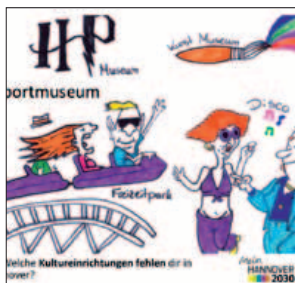
Ergebnisseite des Jugendpanels zu Bildung und Kultur

Stadtteileinrichtungen müssen sich zunehmend zu „Häusern der Ideen“ weiterentwickeln, die den Initiativen der Stadtteile und den Ressourcen von Stadtteilen Plattformen geben. Die „Häuser für Ideen“ sind für alle zugänglich, generationsübergreifend, sind Orte des Wissens und der Kultur, die digitalen Wissenstransfer genauso ermöglichen wie praktische Erprobungsfelder für ein demokratisches Zusammenleben. Sie sind multifunktional und haben eine hohe Aufenthaltsqualität. Die „Häuser für Ideen“ werden gemeinsam mit den Menschen und ihren kreativen Potenzialen entwickelt. Dafür müssen sie Konferenzen einrichten, Netzwerke für Ideen ermöglichen, „Kümmerer“ für Stadtteilanliegen und Umsetzungsmöglichkeiten sein. Im Vordergrund steht nicht die Frage, welcher Funktion der Raum „gehört“, sondern wie der Raum mit seinen Ressourcen gemeinsam von InitiatorInnen genutzt werden kann, unabhängig von Alter, Herkunft oder Geschlecht. Mit dem Ziel, fruchtbare Entwicklungen für den jeweiligen Stadtteil besser zu unterstützen und forcierend bei der Umsetzung zu wirken. Die „Häuser für Ideen“ werden in enger Zusammenarbeit mit den alter[n]sgerechten Quartieren entwickelt.