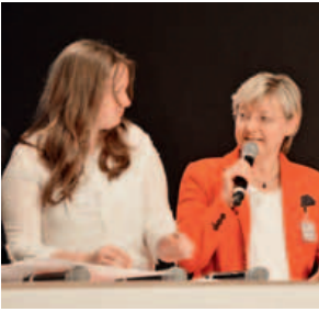
Frauke Heiligenstadt, Nds. Kultusministerin, (re) diskutiert über die Frage „Wie schaffen wir gute Bildung?“ , 16. März 2015

Es wäre falsch, an der Bildung zu sparen. Hannover wünsche ich mir als ein Zentrum für Bildung. (mündlicher Beitrag einer Dialogveranstaltung)