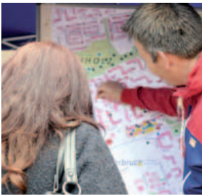
Bürgerbeteiligung vor Ort; „Open-Air-Dialog“ Roder- bruchmarkt, 30. Mai 2015