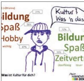
Ergebnisseite des Jugendpanels zu Bildung und Kultur

Hannovers Quartiere sind gut mit kulturellen und Bildungseinrichtungen ausgestattet. Für jede Altersgruppe finden sich individuelle Angebote , die auch intensiv genutzt werden. Unverzichtbar sind die unterschiedlichen PartnerInnen im Quartier, die Einrichtungen und Netzwerke betreiben, sozusagen am Puls der Zeit sind. Mit ihnen zusammen werden die Angebote bedarfsorientiert entwickelt . Ziel ist, kreative Potenziale, Teilhabe und bürgerschaftliches Engagement zu fördern – direkt vor Ort.