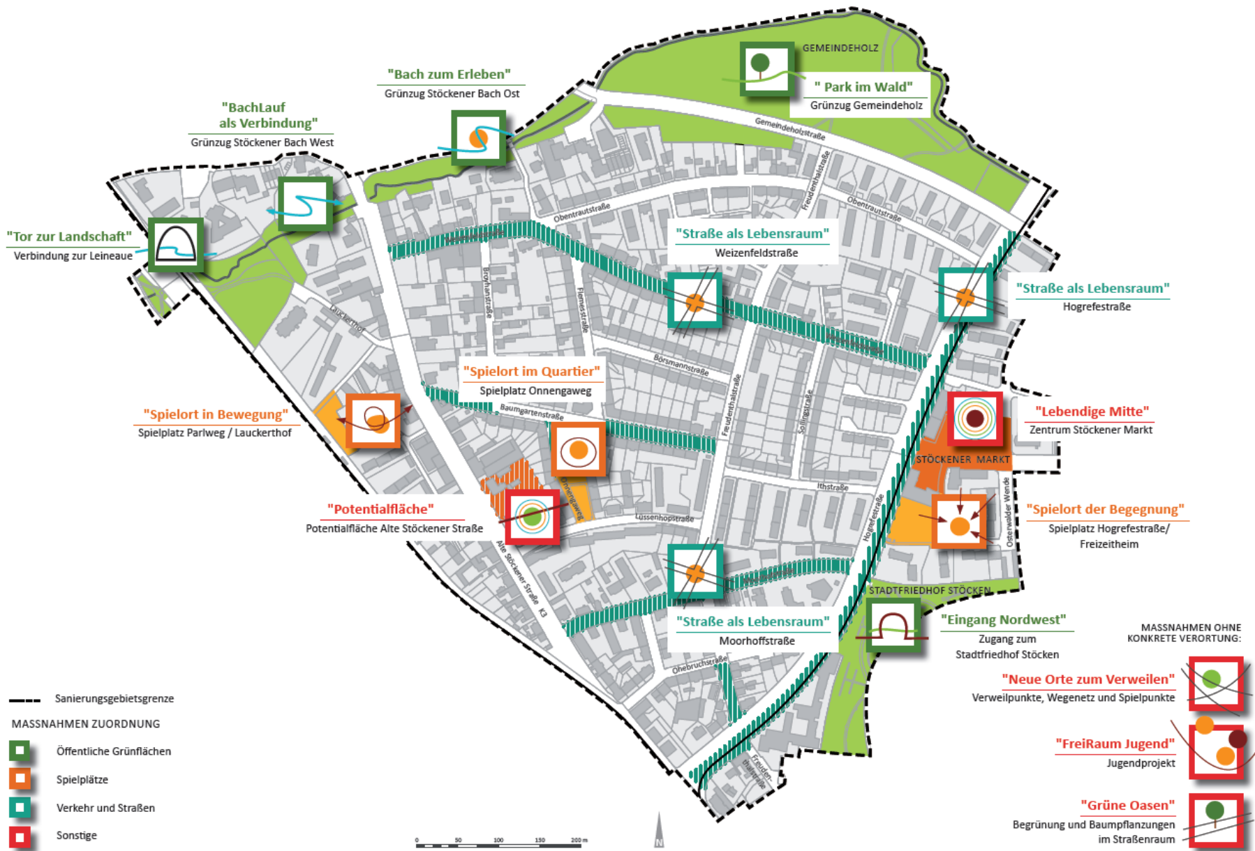
Beispiel FEK STÖCKEN | Rahmenplan mit Maßnahmen LANDESHAUPTSTADT HANNOVER