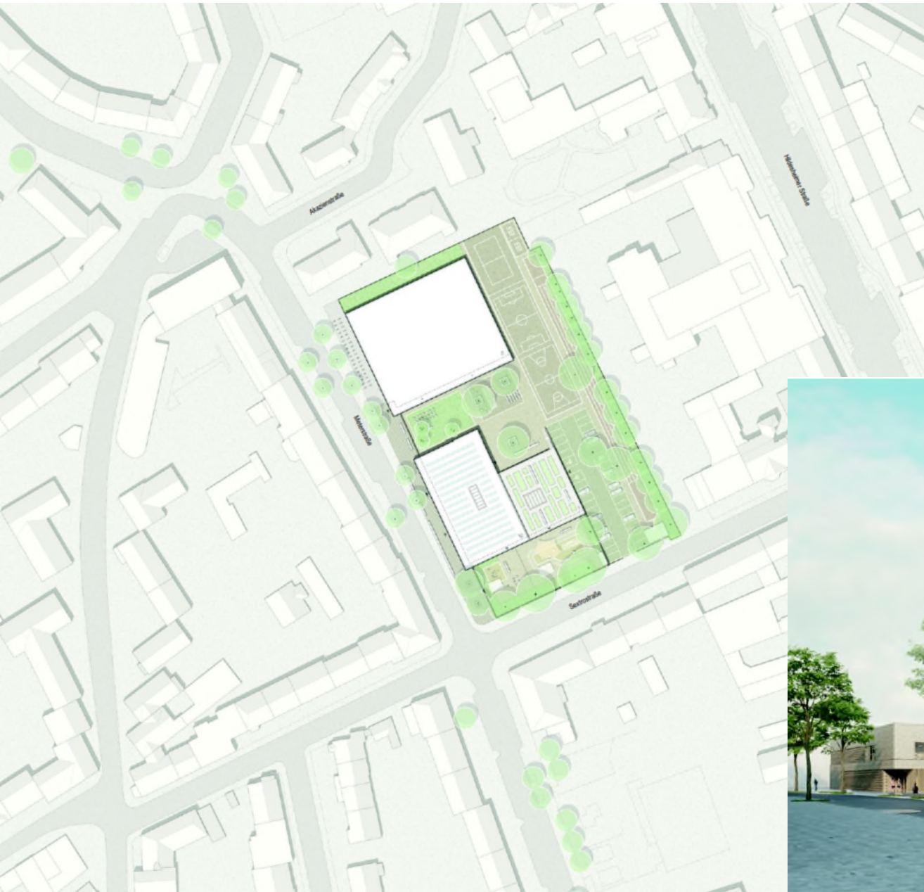
3. Preis huber staudt architekten, Berlin