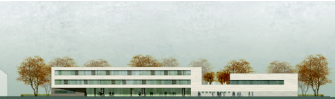
Ansicht von Westen