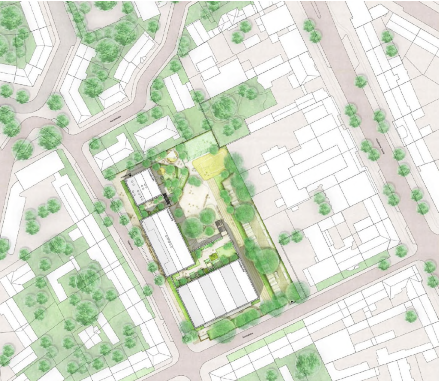
2. Preis BKSP, Hannover