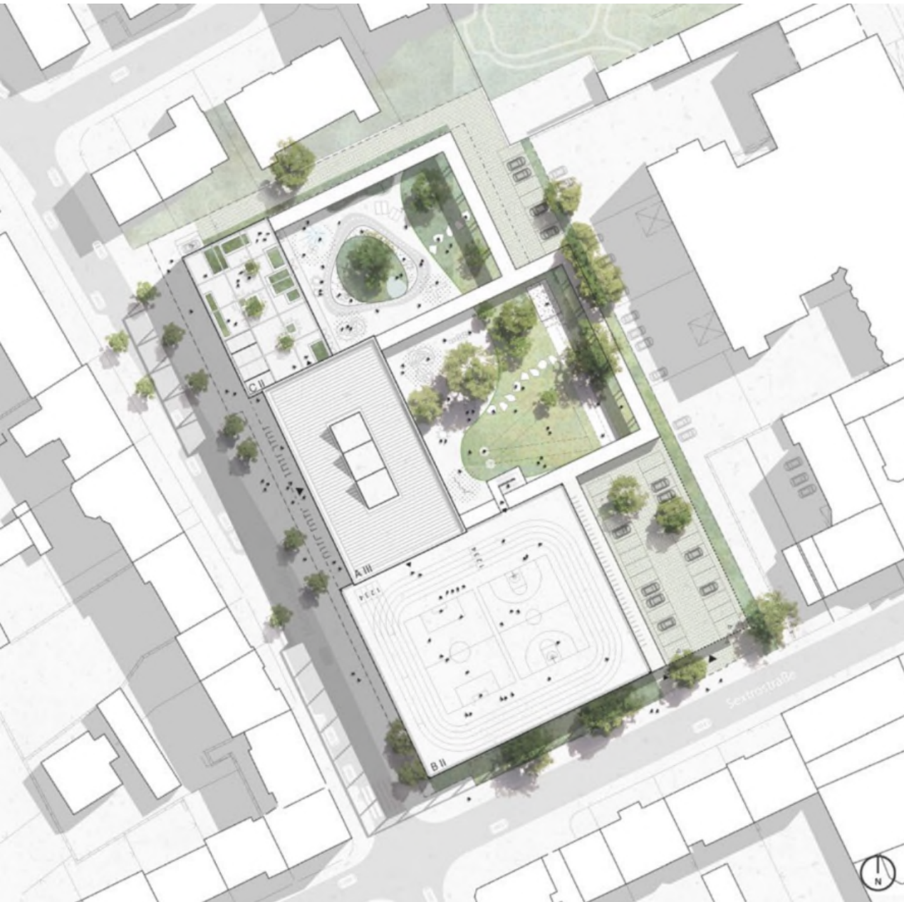
Würdigung Adept Aps, Kopenhagen