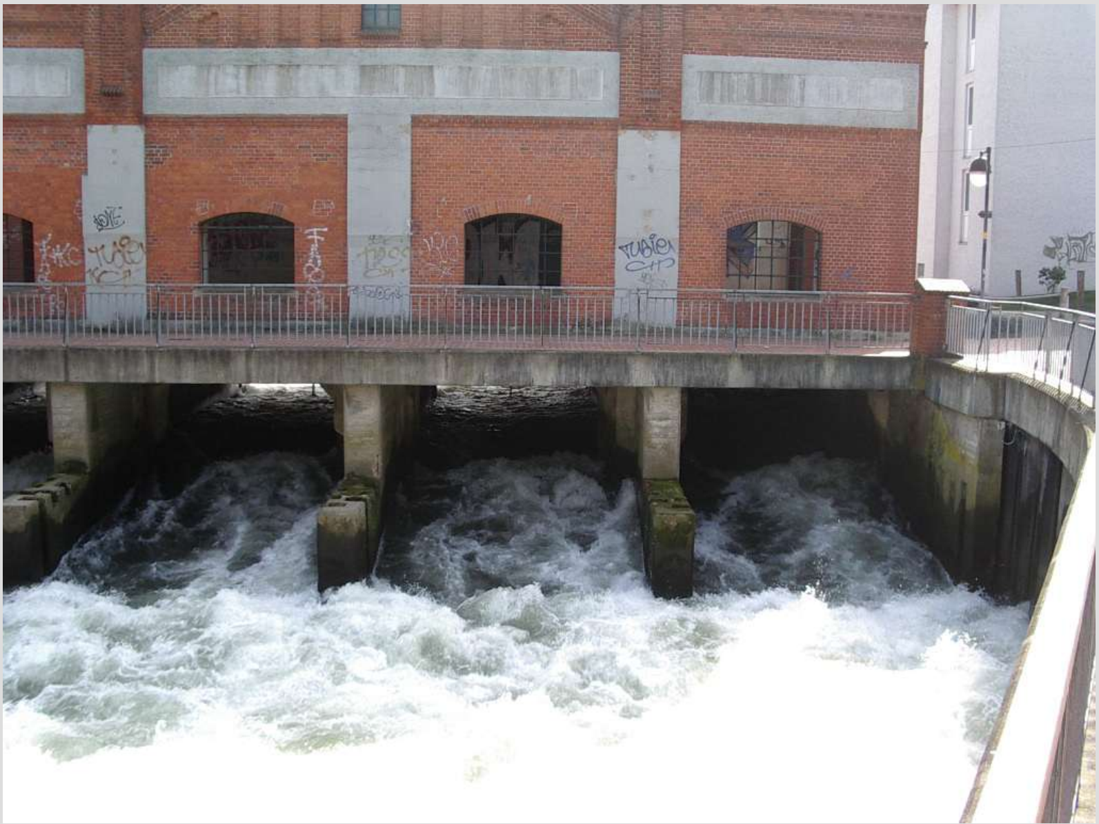
Brückenhaus „Leineinsel Döhren“ - Hochwasserabfluss -