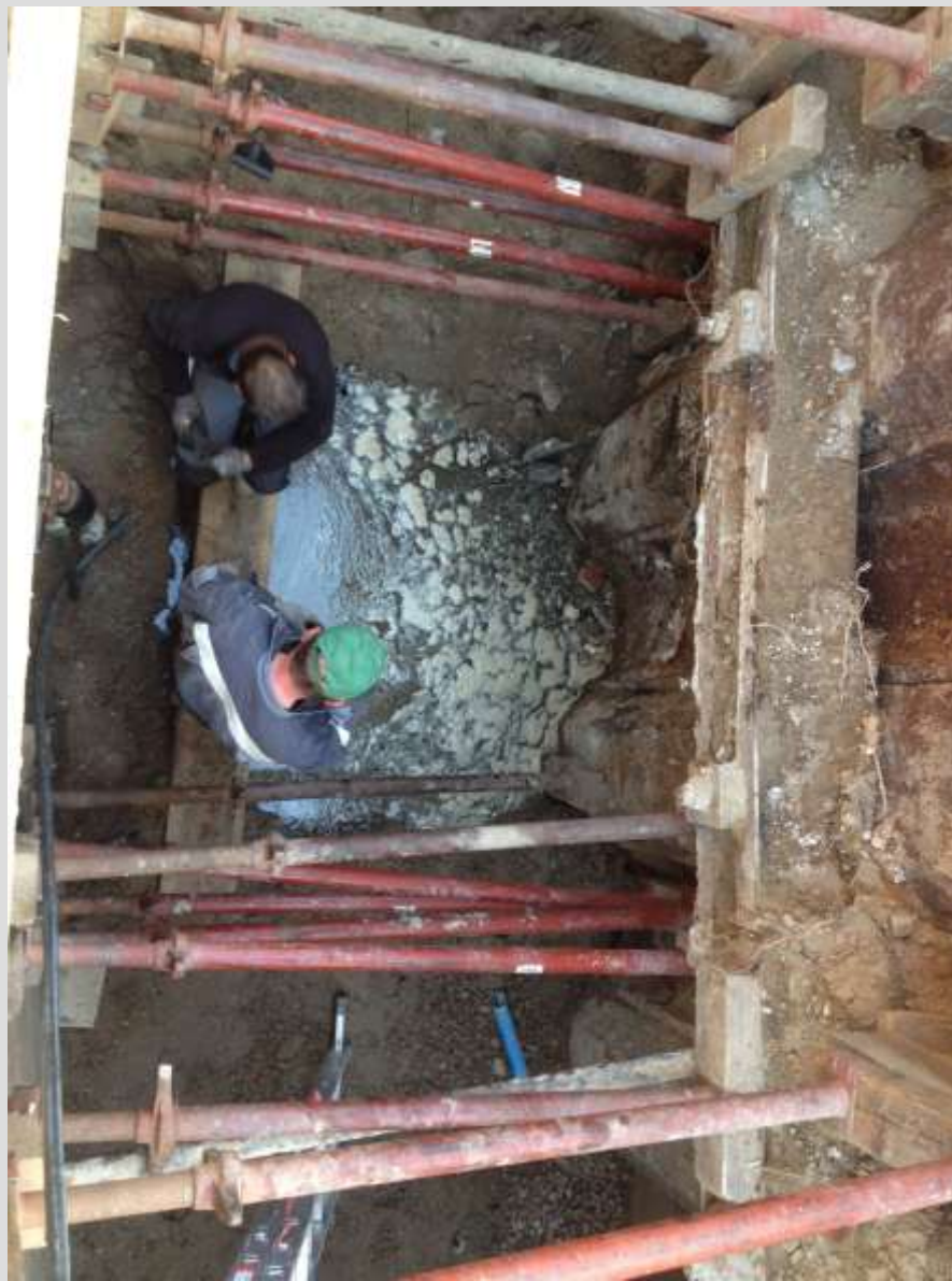
Brückenhaus „Leineinsel Döhren“ - Verbindung zum Leinewasser -