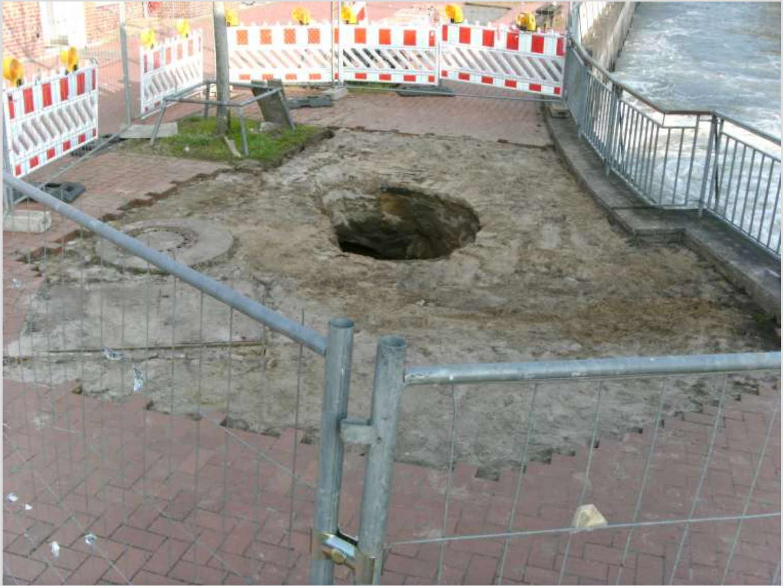
Brückenhaus „Leineinsel Döhren“ - Sicherung -