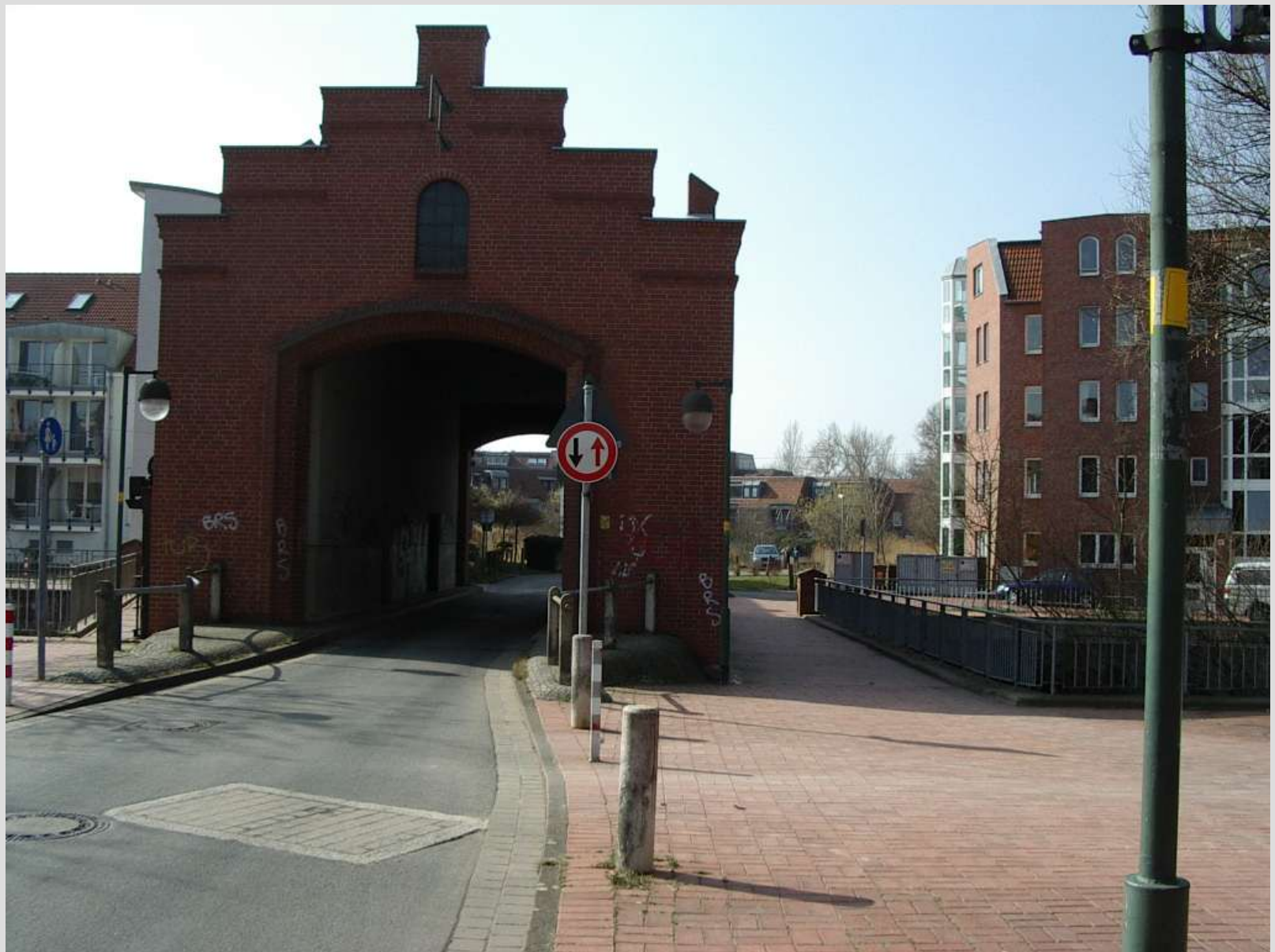
Brückenhaus „Leineinsel Döhren“