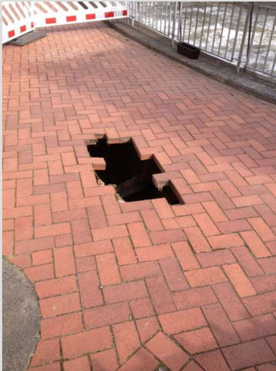
Brückenhaus „Leineinsel Döhren“ - Ausgangslage -