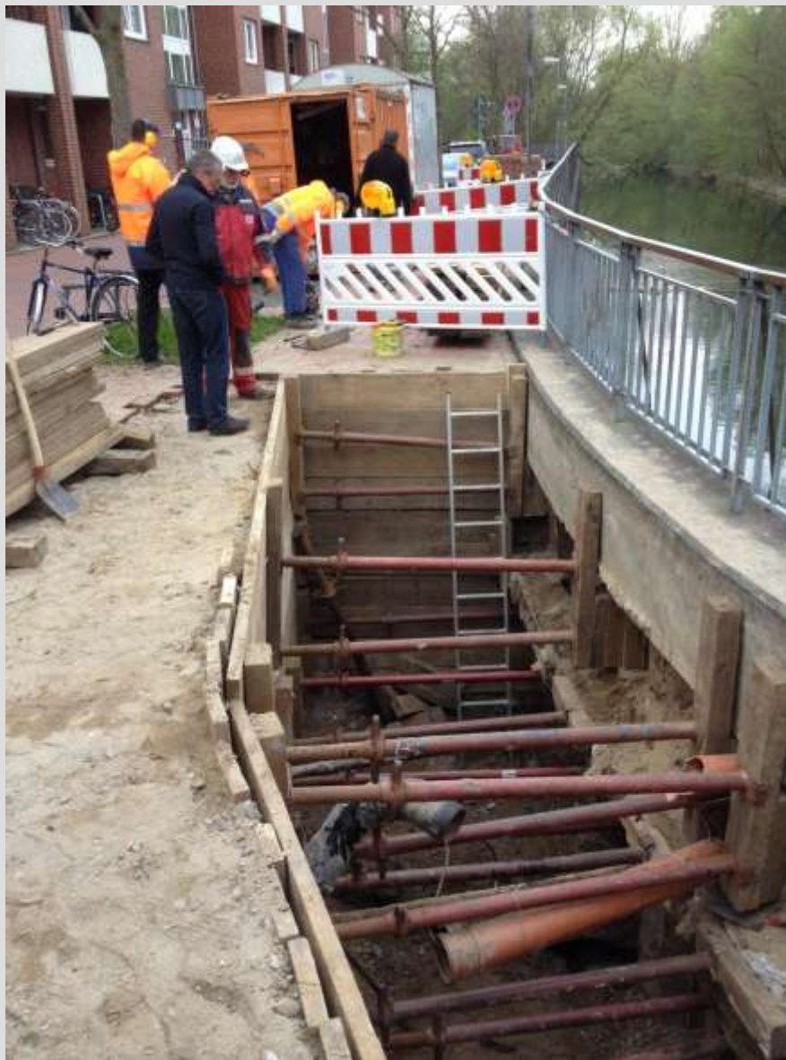
Brückenhaus „Leineinsel Döhren“ - Erkundung der Schadensursache -