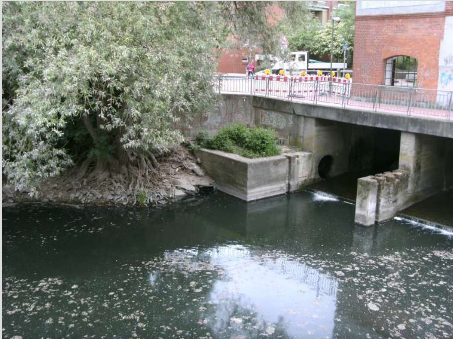
Brückenhaus „Leineinsel Döhren“ - Unterwasser bei geschlossenen Toren -