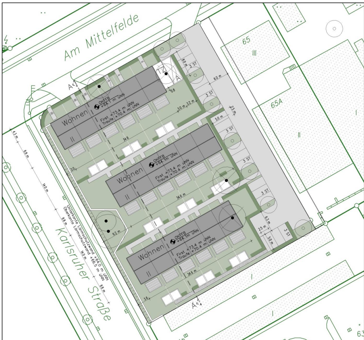
Abb. 3: Vorhaben- und Erschließungsplan, Deutsche Reihenhause Juni 2015

Die Häuser weisen einen Grundriss von 5,9 m x 8,9 m für das Endhaus und von 5,7 m x 8,9 m für das Mittelhaus bei einer Traufhöhe von 6,3 m sowie einer Firsthöhe von 9,3 m auf. Das Dach wird als Satteldach mit einer Dachneigung von 34° ausgebildet. Eine Unterkellerung der Häuser erfolgt nicht. Bei der nördlichen Reihenhausezeile wird aus Gründen des Schallschutzes eine Grundrissorientierung vorgesehen, sodass im Dachgeschoss an der nordwestlichen Fassadenseite ein fensterloser Abstellraum vorgesehen ist. Ausführlich sind die erforderlichen Schallschutzmaßnahmen im Abschnitt 4.7 dargestellt.