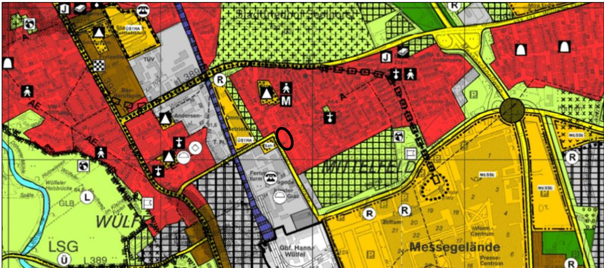
Abb. 1: Ausschnitt aus dem Flächennutzungsplan der Stadt Hannover