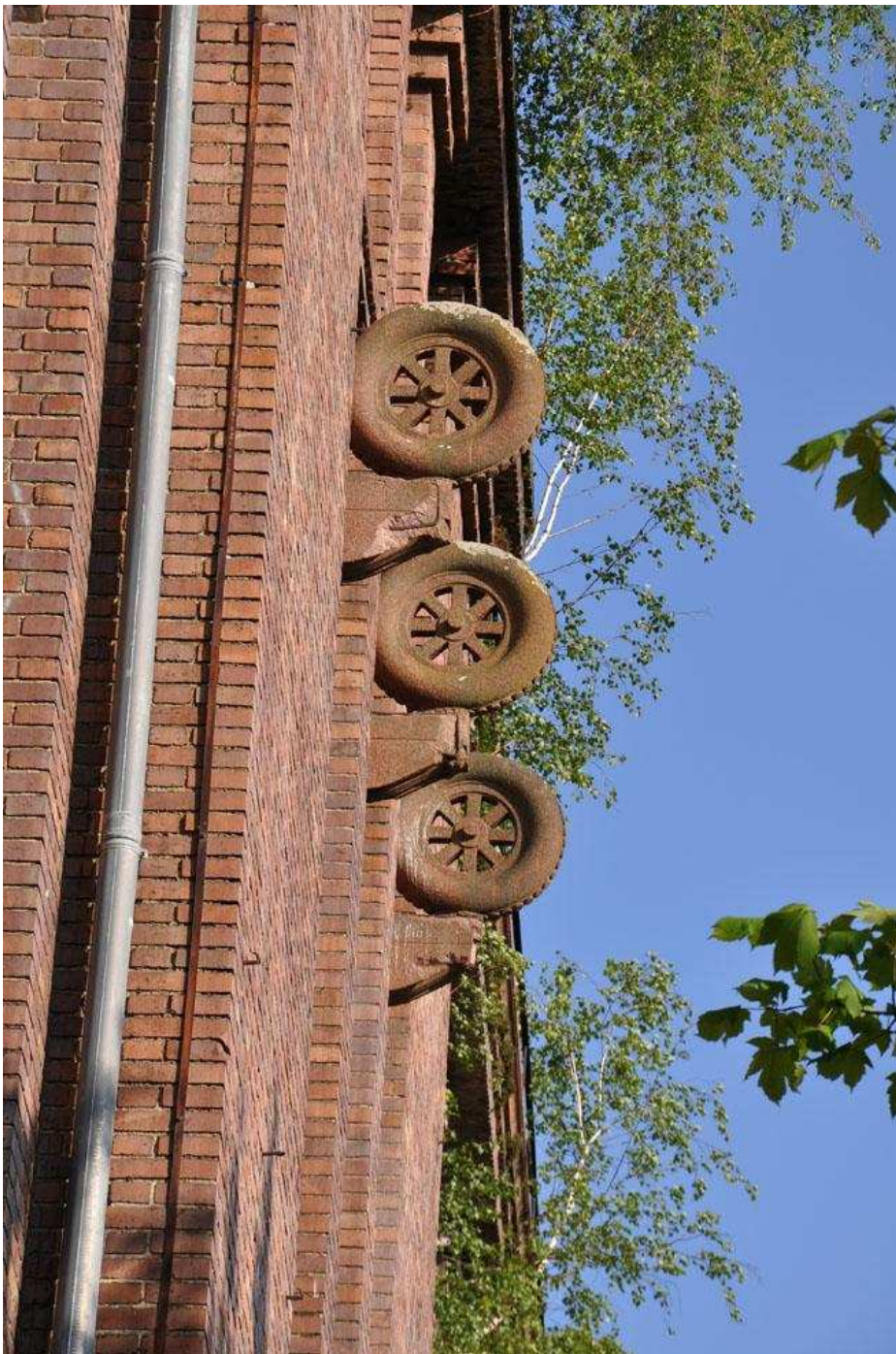
„Reifen aus Sandstein“ / an zwei Orten der Fassade (2x3 Stück)