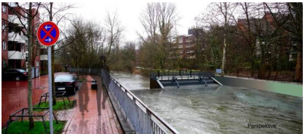
Abb. 3: Fotomontage: Blick von der Straße Am Brückenhaus nach Norden auf die geplante Wasserkraftanlage