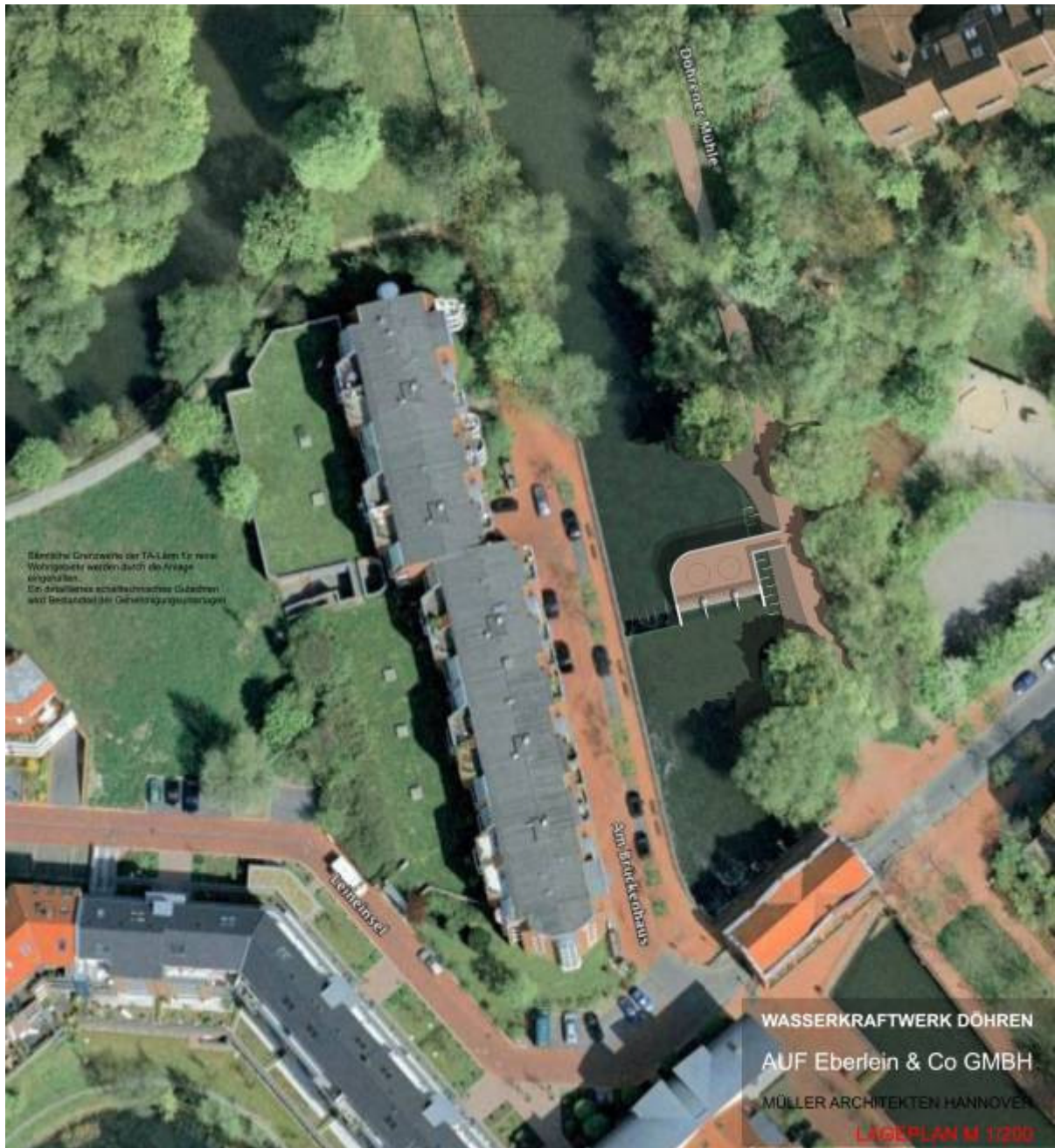
Abb. 1: Fotomontag Luftbild