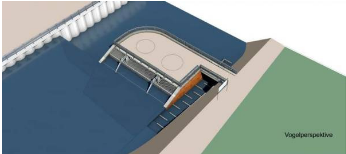
Abb. 2: Zeichnung: die geplante Wasserkraftanlage aus der Vogelperspektive