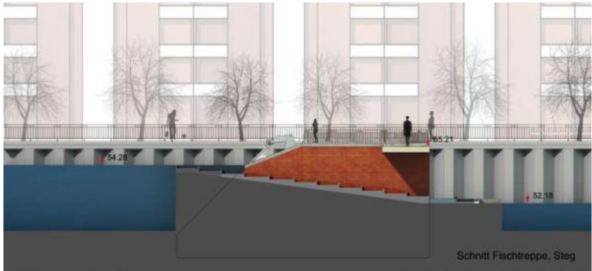
Abb. 6: Schnitt durch die Fischtreppe östlich der geplanten Wasserkraftanlage