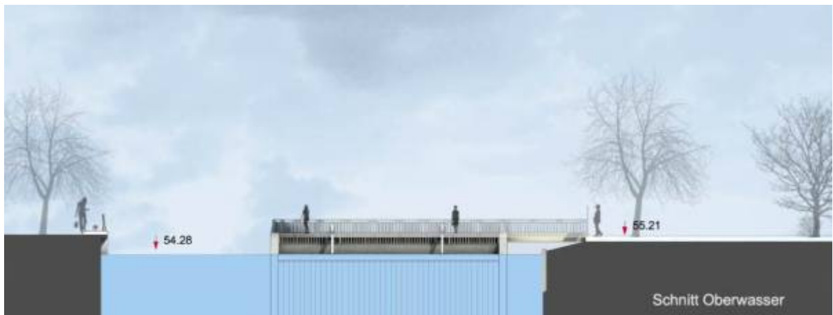
Abb. 4: Schnitt durch das Oberwasser zwischen Brückenhaus und geplanter Wasserkraftanlage, Blick nach Norden