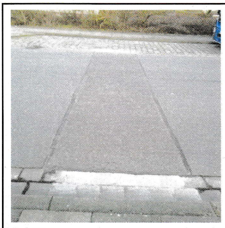
es geht auch anders, sauber und ordentlich