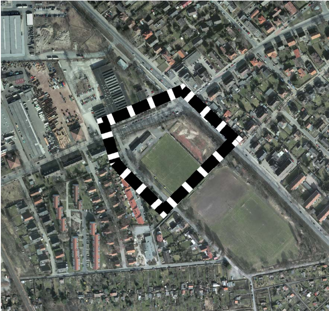
Luftbildaufnahme 2011

ße. Die starke Frequentierung ist nicht zuletzt durch den von ihr erschlossenen Industriestandort Volkswagen AG / Volkswagen Nutzfahrzeuge (VWN) bedingt. Untergeordnet dient sie in der Weiterführung durch die Straße "Alt Vinnhorst" alternativ zur Autobahn A 2 als Verbindung zwischen dem Nordwesten Hannovers und der Nachbarstadt Langenhagen im Norden.