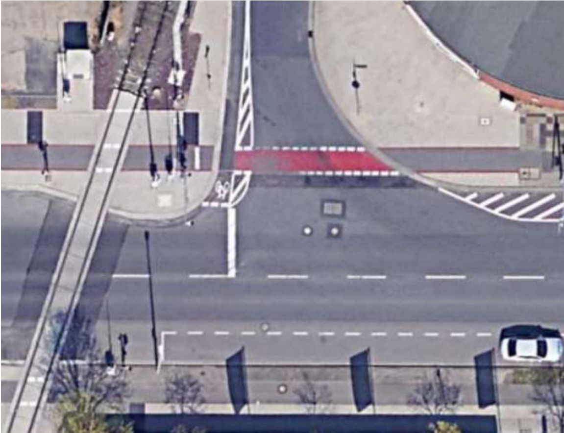
Abb. 3: Derzeitige Situation nach der Umgestaltung