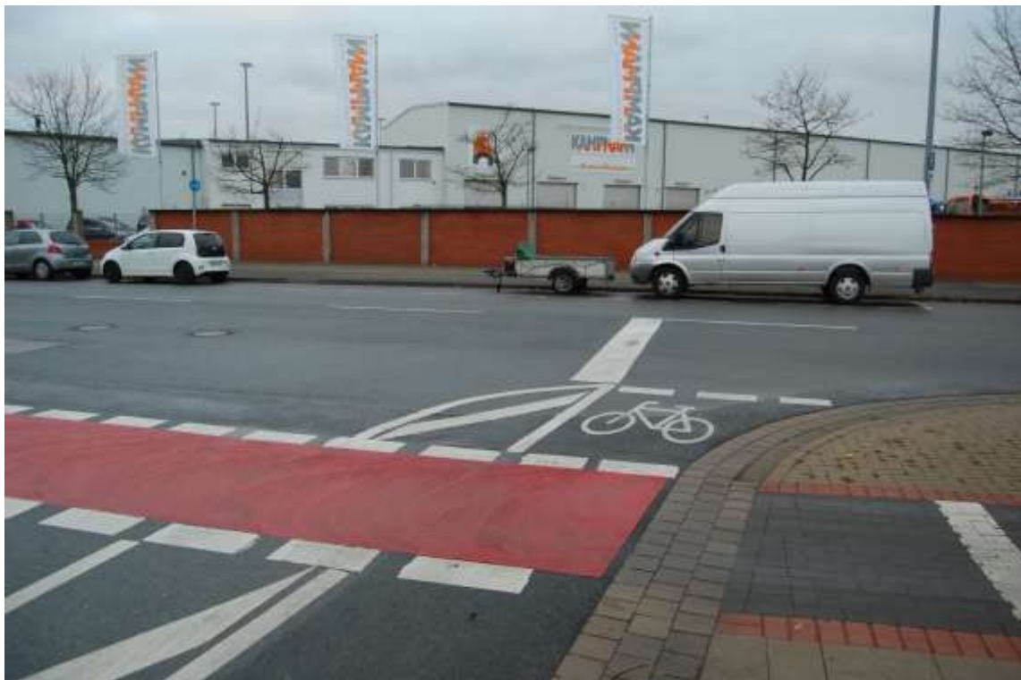
Abb. 4: Eine Auffahrt auf den benutzungspflichtigen Radweg ist nicht möglich