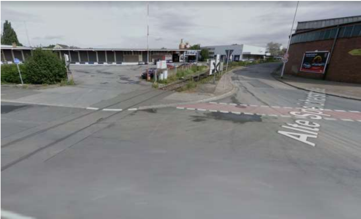
Abb. 1: Situation vor der Umgestaltung