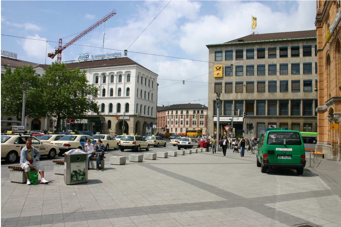
Foto 2: Blick vom Ernst-August-Platz in Richtung Hauptpost u. Kurt-Schumacher-Str.

Der Bereich um das historische Gebäude des Hauptbahnhofs mit dem vorgelagerten Ernst-August-Platz präsentiert sich deutlich vielfältiger als der zuvor beschriebene Abschnitt. Neben der Bahnhofsfront prägt das denkmalgeschützte Gebäude des ehemaligen Russischen Hofs, heute Geschäftshaus von Saturn, das Bild in Blickrichtung des geplanten Centers. Der große Gebäudekomplex der Hauptpost soll dem geplanten Bauvorhaben weichen.