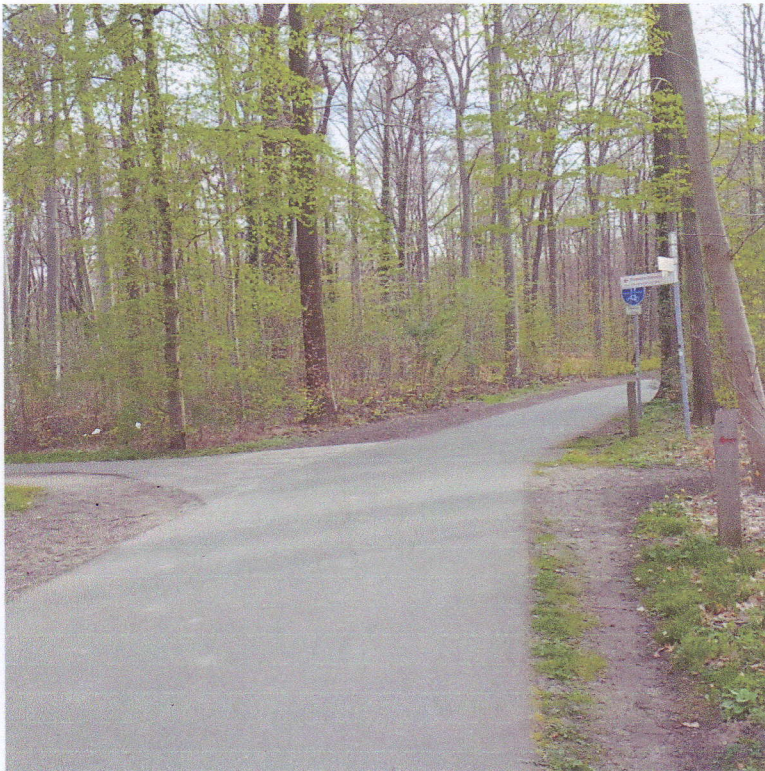
Ansicht von der südlichen Seite. Der Senatorweg ist am linken Bildrand. Rechts ist die Laufstreckenmarkierung zu sehen.