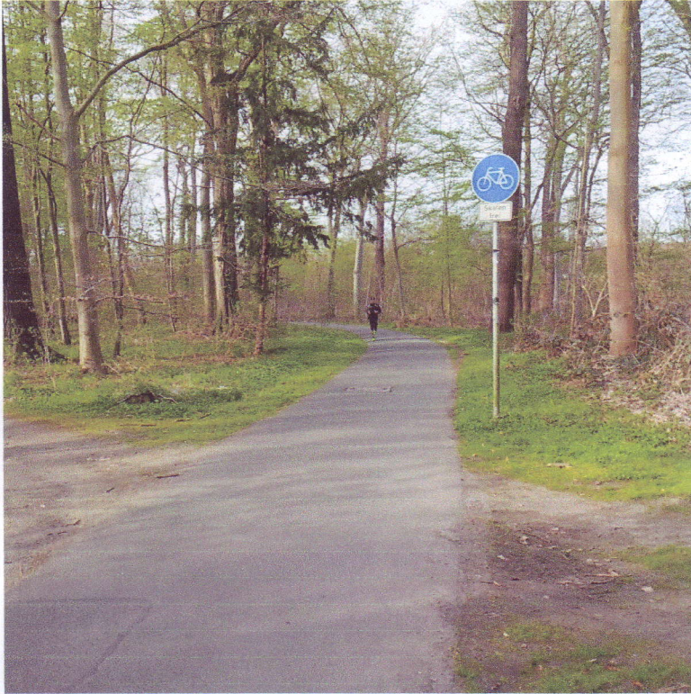
Ansicht von der nördlichen Seite