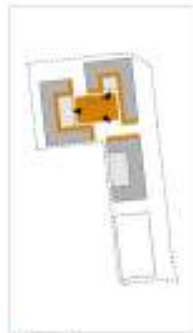
1. Schnitt (Süd)