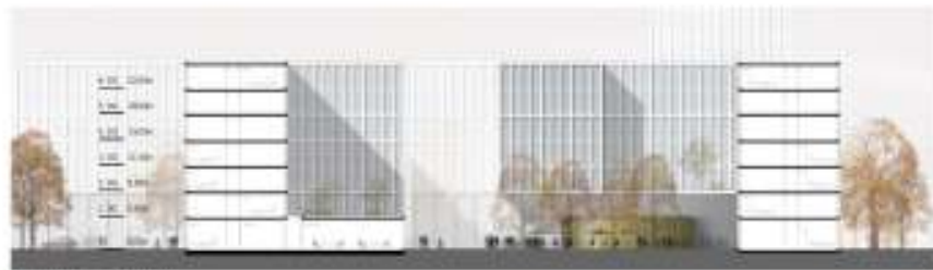
3. Schnitt (West)