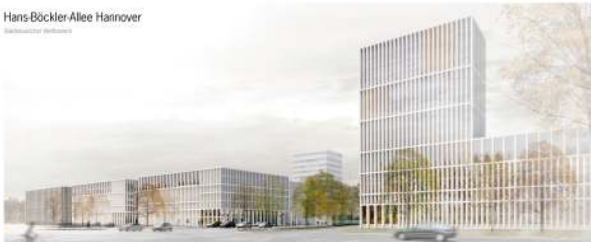
© Hentrich | Architects | 2012 and 2013/14