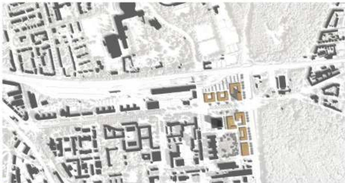
© Hentrich | Architects | 2012