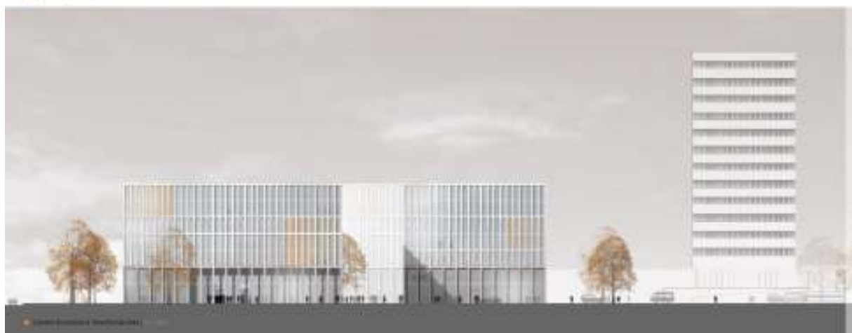
© Hentrich | Architects | 2012/13