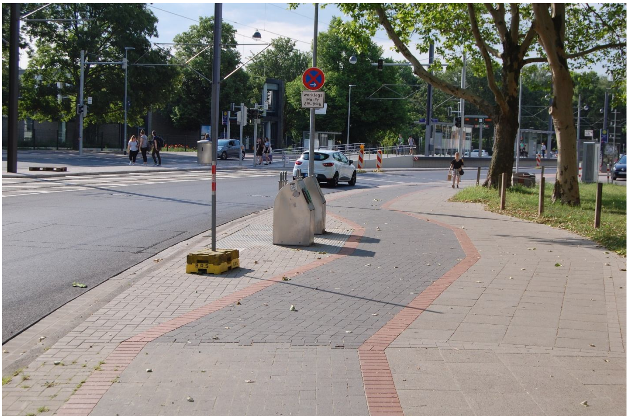
Abb. 2: Tatsächliche Position der Glascontainer