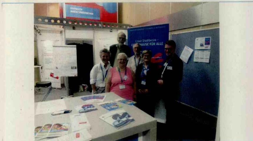
PBK - Präventionsrat Buchholz-Kleefeld

Stadtbezirksrat Buchholz-Kleefeld, Sitzung am 14.09.2017 27