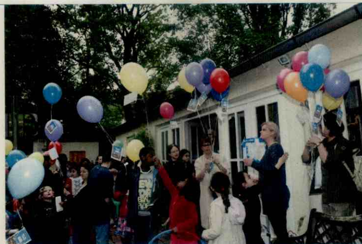
PBK - Präventionsrat Buchholz-Kleefeld