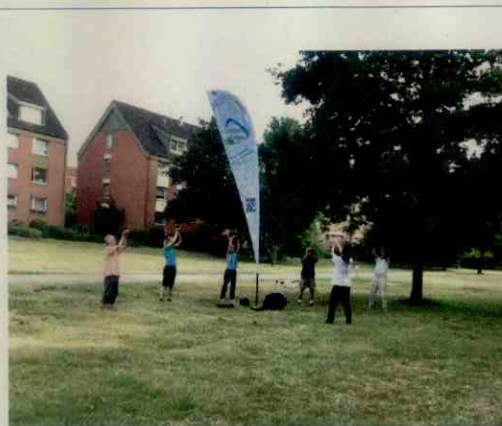
PBK - Präventionsrat Buchholz-Kleefeld

Stadtbezirksrat Buchholz-Kleefeld, Sitzung am 14.09.2017 28