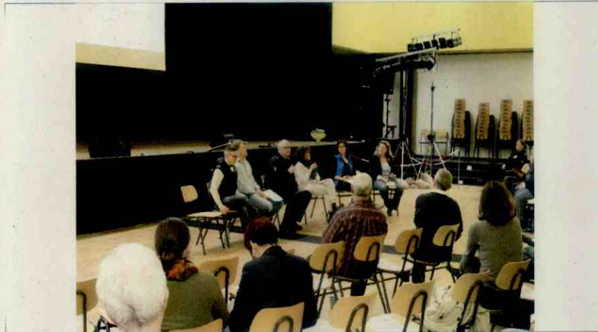
PBK - Präventionsrat Buchholz-Kleefeld