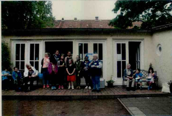
PBK - Präventionsrat Buchholz-Kleefeld