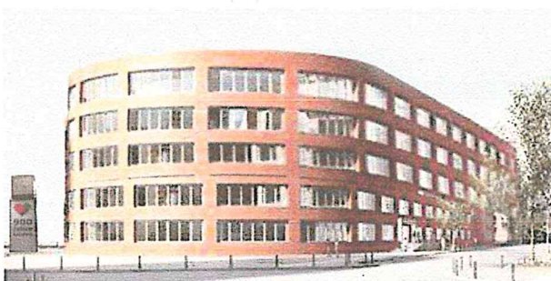
1. Fotomontage Bebauung „Grüner Hügel“ Grube/Gardemin 8/2016

zu 3.) Das Grundstück „Grüner Hügel“ befindet sich an einer exponierten Lage zwischen Limmerstraße, Küchengartenplatz und Ihmezentrum. Auf dem städtebaulich anspruchsvollen Ort kann bspw. ein Wohn- und Geschäftshaus entstehen, das als Solitär deutlich über die Bauhöhe der Limmerstraße herausragt und damit den Stadtteil Linden-Nord dem Ihmezentrum eine architektonische aber auch alltagspraktische Anbindung verschafft.