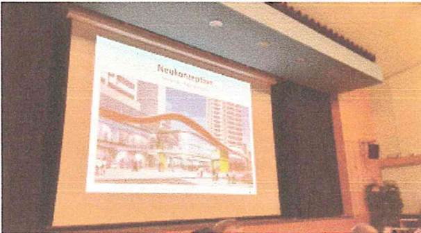
Präsentation des Einzelhandelskonzeptes des Mehrheitseigentümers am 9.3.2016 im Bezirksrat Linden-Limmer

zu 1.) Auch wenn der neue Gewerbeigentümer bislang der Ankündigung des Einzelhandelskonzeptes keine Taten hat folgen lassen, so wird im Erdgeschoss des Ihmezentrums auf kurz oder lang eine Einzelhandelnutzung entstehen. Ein Haupteingang nahe der Spinnereistraße ist dabei aus baulichen und verkehrlichen Gründen sehr wahrscheinlich.