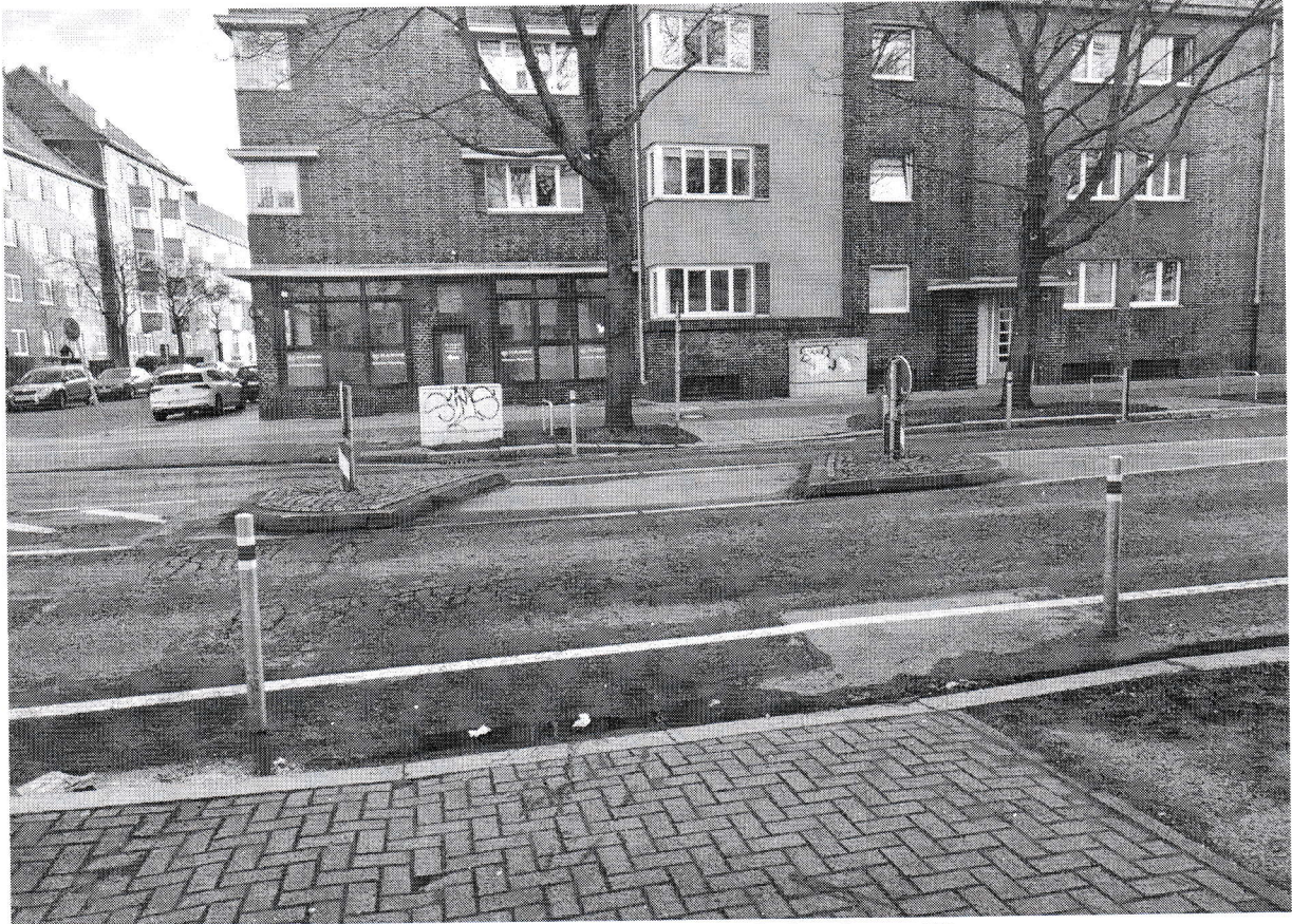
Abbildung 1: Fußgängerfurt aus Blickrichtung Westen