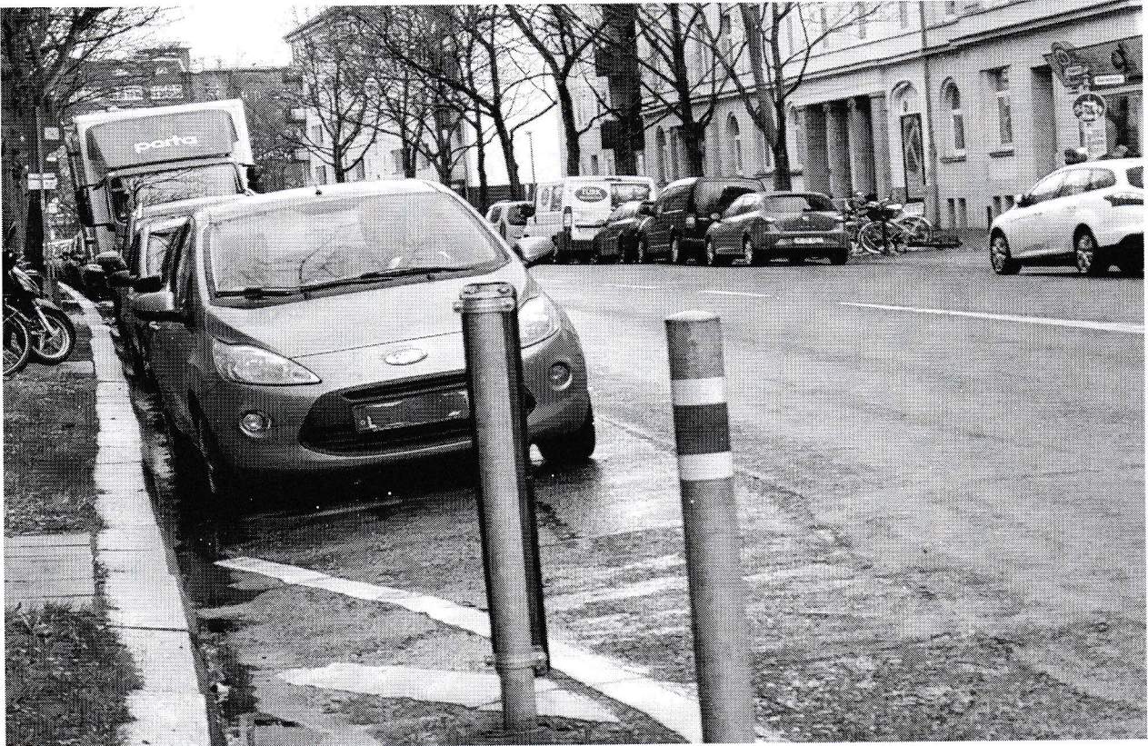
Abbildung 2: Blickrichtung Süden von der Ostseite