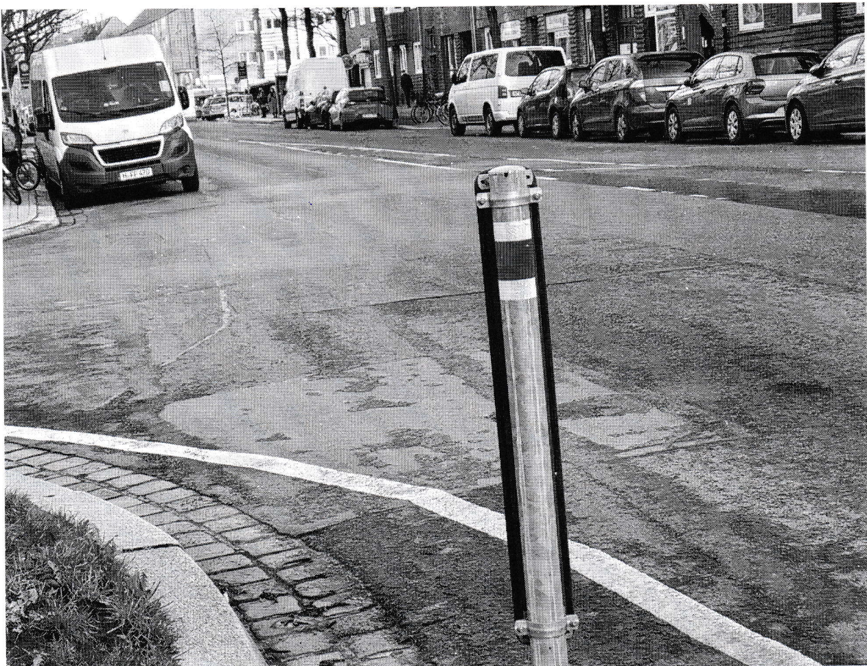
Abbildung 3: Blickrichtung Norden von der Westseite