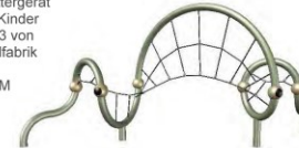
Grafik: Berliner Seilfabrik

Sandspielfläche mit - Bocktisch, anfahrbar