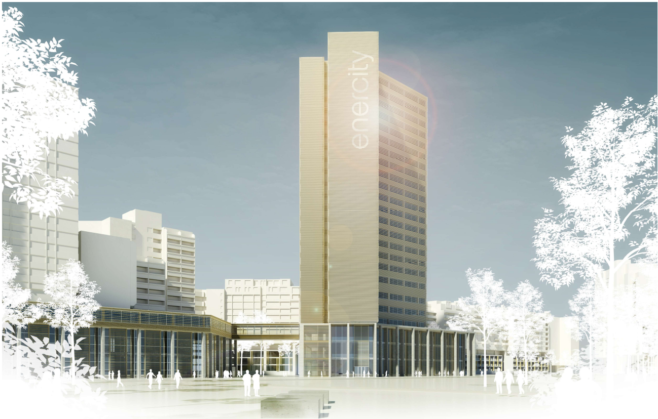
Schaubild 2: Entwurf gmp | Haupteingang Energy-Turm

Die zweite Variante sieht an Stelle der Sanierung des vorhandenen durch die SWH genutzten Büroturms eine vollständige Neuerrichtung eines Verwaltungssitzes für die SWH an der Stelle vor, an der sich zurzeit noch die von den Fachbereichen Gebäudemanagement sowie Jugend und Familie genutzten Bürogebäude befinden. Der neue Verwaltungssitz soll aus drei, durch mehrstöckige Brücken miteinander verbundenen, mit Glasfassaden versehenen, Bürogebäuden, die jeweils einen rundlichen Grundriss aufweisen, bestehen. Das höchste dieser drei Gebäude soll 16 Stockwerke aufweisen, die anderen beiden Gebäude fünf und sechs Stockwerke. Dieser geplante Neubau erstreckte sich auch auf am Ihmeplatz 1 gelegene Flächen, die aktuell mit einem Appartementhaus bebaut sind, in dem sich insgesamt 174 Wohnungen befinden, von denen 84 Wohnungen Sondereigentum der IZH Wohnungsgesellschaft mbH sind, die restlichen Wohnungen jedoch unterschiedlichen Eigentümern gehören und somit nicht von dem Zwangsversteigerungsbeschluss umfasst sind. Nach Fertigstellung des Neubaus sieht diese Variante den Abriss des noch vorhandenen, von der SWH genutzten Büroturms vor. An dessen Stelle soll abschließend ein Kundenzentrum der SWH errichtet werden, das durch eine Überdachung baulich mit dem zu errichtenden fünfstöckigen Gebäudeteil des geplanten Verwaltungssitzes verbunden wäre.