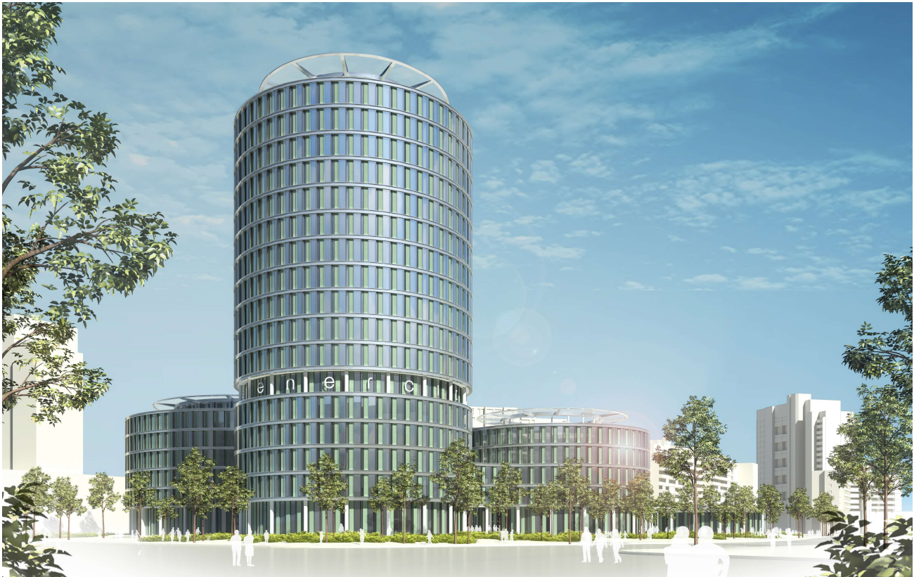
Schaubild 3: Entwurf gmp | Platzperspektive Energy-Turm

Die Umsetzung beider Planungsvarianten bedeutete nicht nur eine grundlegende Umgestaltung der Ausrichtung und des öffentlich wahrnehmbaren Erscheinungsbilds des IZH, sondern sie führte auch durch den großflächigen Abriss der Einzelhandelsflächen zu einer Vernichtung einer großen Anzahl von Miteigentumsanteilen, was die Unrichtigkeit der Teilungserklärung zur Folge hätte. Ferner wäre auch in den neu zu bebauenden Flächen die unübersichtliche, flickenteppichartige Eigentumszuordnung nicht überwunden. Für eine rechtsichere und ordnungsgemäße Umsetzung dieses Plans wäre daher eine völlig neue Teilungserklärung notwendig.