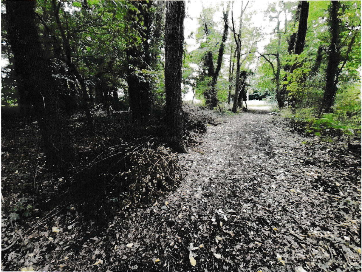
Anlage zur Anfrage „Vermüllung der Wietze“