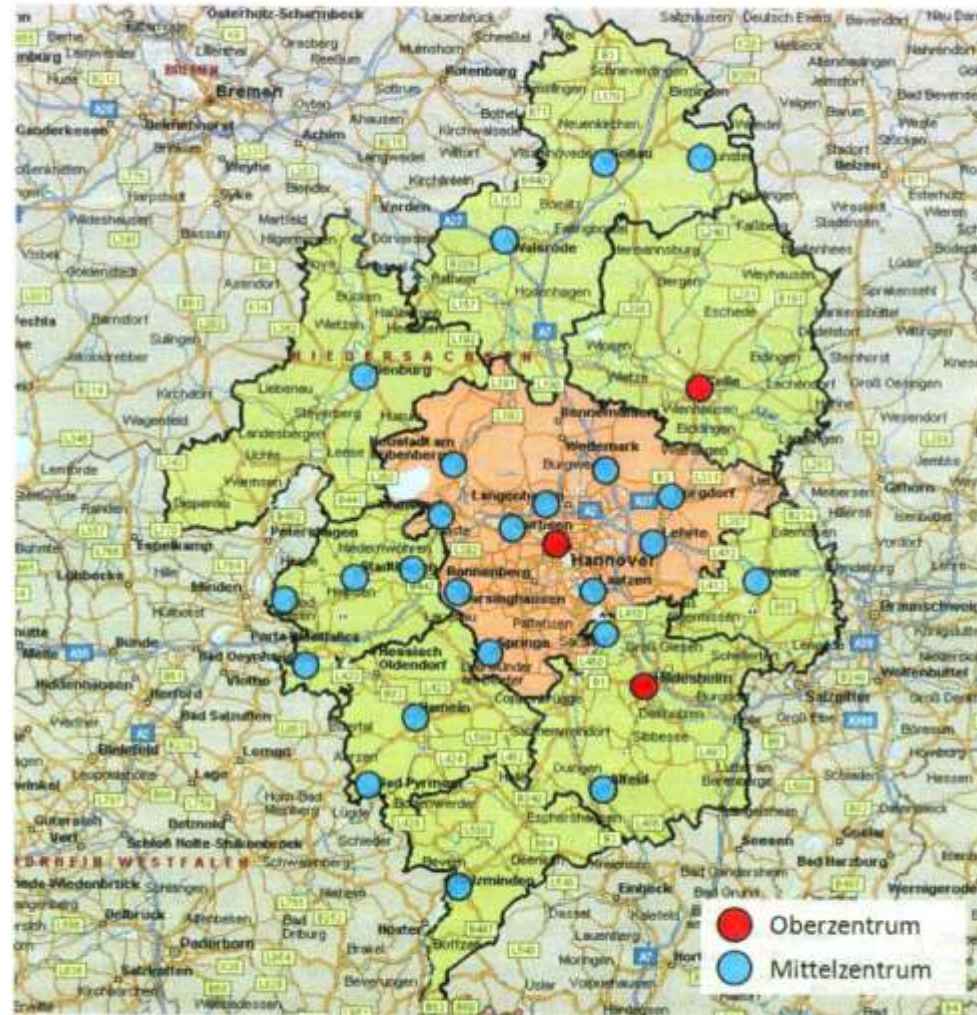
Abb. 13: Überblick: Ober- und Mittelzentren im Erweiterten Wirtschaftsraum