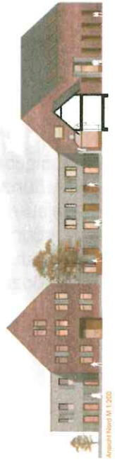
Ausschnitt Nord M 1:200