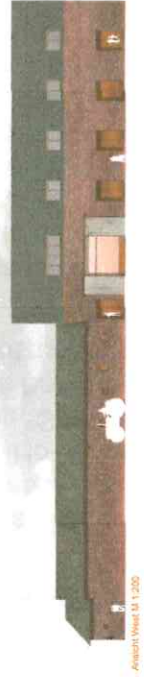
Ausschnitt West M 1:200