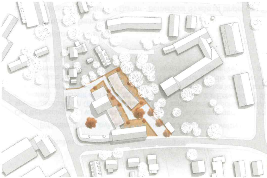
Lageplan M 1:1500