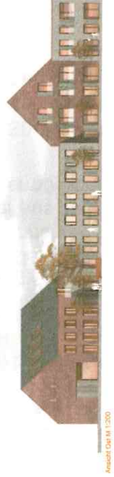
Ausschnitt Ost M 1:200