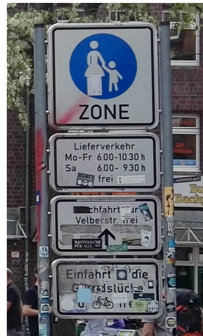
Hinweisschild Fußgängerzone Limmerstraße, Einfahrt Leinaustraße

In den vergangenen Monaten wird die Limmerstraße insbesondere im westlichen Abschnitt im Übergang zum fußgängerzonenfreien Abschnitt vermehrt verkehrswidrig in deutlich unangemessener Geschwindigkeit durchfahren. Es fehlt an eindeutigen Hinweisen und Maßnahmen, die Ein- und Ausfahrt nur für den Linienverkehr vorzuhalten. Insbesondere Lieferfahrzeuge der DHL, des Apothekendienstes und andere Lieferfahrzeuge halten sich zudem auch an den regulären Einfahrtsbereichen nicht an das Fahrverbot ab 9:30 bzw. 10:30 Uhr in der Fußgängerzone.