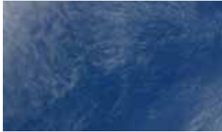
Hören Sie mal ...