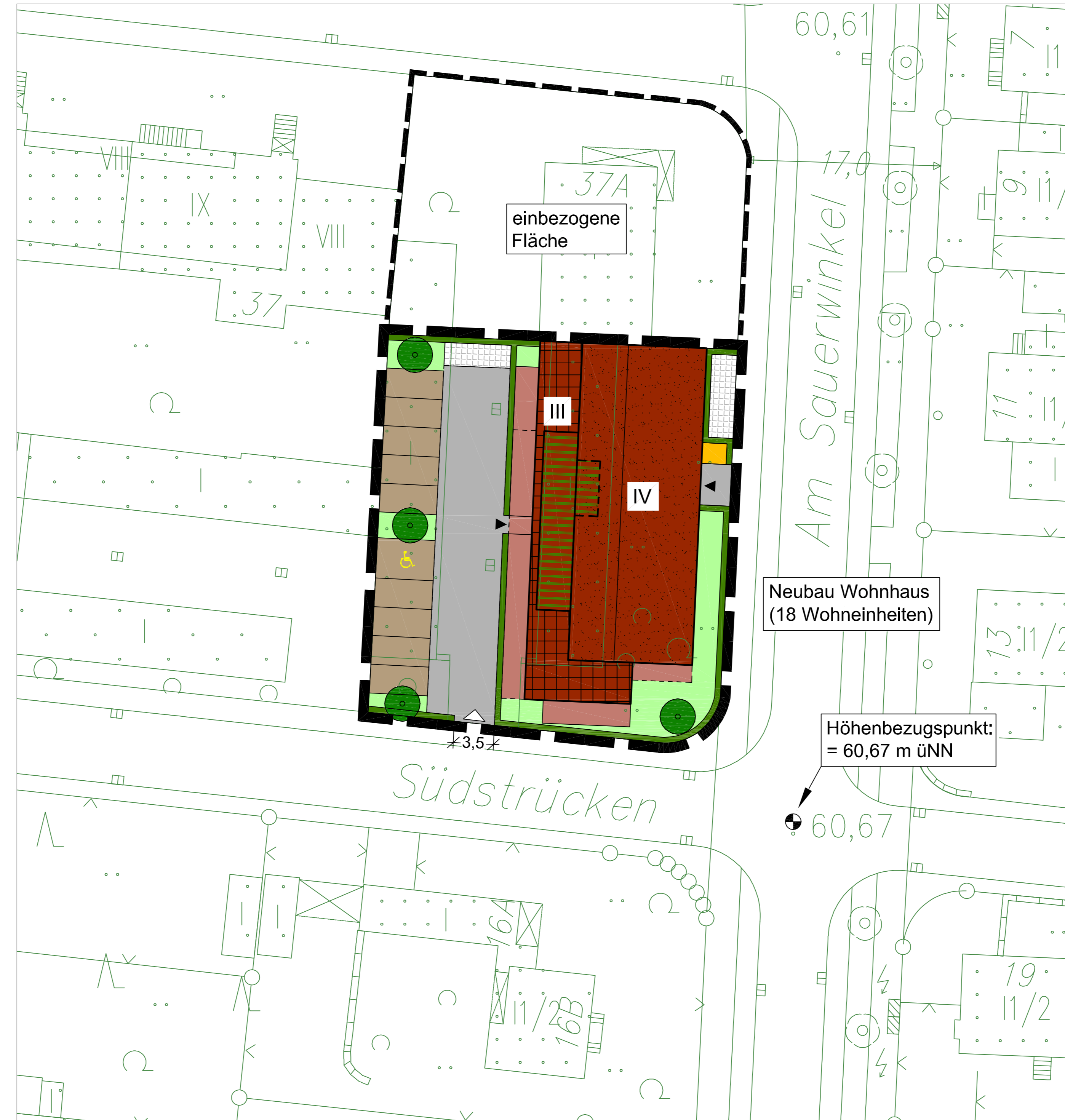
Lageplan, M 1:250